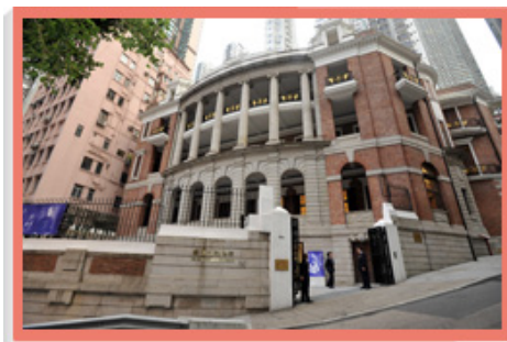
本署在二零零六年把孙中山纪念馆的管理服务外判。

由于先前政府冻结招聘人手，本署亦不得不把辖下若干文化设施的管理服务外判。这些设施包括：二零零五年外判服务的香港文物探知馆；二零零六年外判服务的孙中山纪念馆和葛量洪号灭火轮展览馆；以及二零零七年外判服务的屏山邓族文物馆暨文物径访客中心。