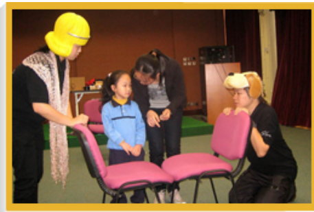
香港公共图书馆经常举办各式各样与阅读有关的活动，培养儿童对阅读的兴趣。在39间图书馆举行的专题故事剧场—「勇闯科技城」是其中一项活动。