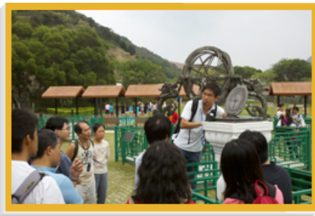
参观者通过天文公园内的复制品认识中国古代天文仪器。

太空馆已获得拨款，为两个展览厅进行翻新工程，并会设计和装置新展品，以便营造一个模拟环境，让参观者体会穿梭时空的经验。太空馆的网站( http://hk.space.museum )载有大量关于天文和太空科学的资料和教材，深受大众欢迎。