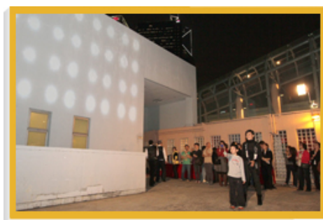
「艺术家留驻计划2010 | 新媒体艺术 | 香港视觉艺术中心」的开幕节目「为互动而互动」，从另类角度探索新媒体艺术。

另外，香港视觉艺术中心于二零一零年五月就「艺术家留驻计划2010」征召以新媒体艺术为题的留驻计划提案。两个获选的提案于二零一零至一一年期间展示创作计划。第一个留驻计划「为互动而互动」由曹飞扬及吴慧心提交，有关活动于二零一零年十月至二零一一年五月举行。