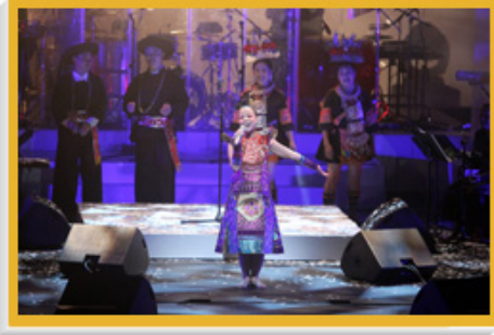
中国殿堂级歌后朱哲琴与多位当代民族音乐传人携手演出的音乐会，是「新视野艺术节2010」的开幕节目。

十一日期间举行，呈献多个世界首演节目，包括殿堂级歌后朱哲琴联同多位当代民族音乐传人携手演出的开幕音乐会，以及由Budgie（英国）、Leonard Eto和Sugizo（日本）、Mabi（南非）和Knox Chandler（美国）同台献艺的音乐大汇演「翼动：跨文化鼓乐激奏」。