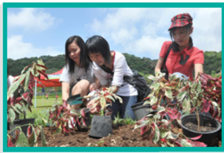
「佐敦谷公园同乐日」的参加者正在社区园圃栽种植物。

年内，本署继续与区议会及地区组织合办共20项「社区种植日」活动。其间，逾4 600名参加者合共种植了约90棵树木和33 000株灌木。