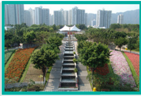
大埔海滨公园的花园占地2 500平方米，扇形花圃分成九排，广植灿烂时花。

大埔海滨公园占地22公顷，是本署辖下最大型的公园。园内有一座香港回归纪念塔，高32米，游人可登上塔顶俯瞰吐露港和邻近地区的美丽景致。公园的其他设施包括长达1 000米的海滨长廊、昆虫屋、露天剧场、中央水景设施、有盖观景台、儿童游乐场、草地滚球场、门球场，以及多个主题花园：花海、香花园、锦葵园、西式花园、生态花园、棕榈园、香草园、榕树园和茶花园。