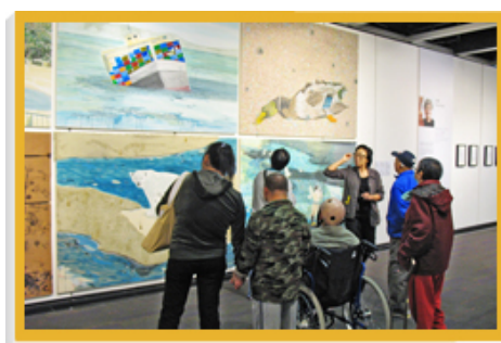
「艺游邻里计划V」揭幕展把艺术带进不同的社群，并为参观者提供免费导赏服务。

艺术推广办事处年内还举办各项活动，通过视觉艺术促进社会共融，当中包括与香港版画工作室合办的「长幼同行—社区艺术推广计划」，以长者、新来港定居人士、低收入家庭，以及病态赌徒和未成年母亲所生子女等社群为对象。活动包括率先于二零一零年四月举办的一系列工作坊，以及最后于二零一零年八月举办的「序曲—长幼同行社区艺术推广计划」展览。此外，办事处还与香港展能艺术会合办「艺无疆：新晋展能艺术家大汇展2010」。