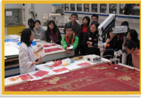
文物修复组人员（左一）向大学生介绍该组的工作。

为促进与外地的同业进行专业交流及紧贴业内的最新发展，修复组年内派员在内地举行的国际博物馆协会第二十二届大会、第七届历史建筑结构分析国际会议、自然因素与文献保存保护亚洲地区研讨会，以及在美国举行的国际博物馆协会2010年度金属文物修复会议上发表多篇论文。论文题目包括《香港的文物修复教育》、《衡情度理— 修缮，还是更换？》、《各种内墙油漆之有机化合物和挥发物的成份比较及对纸本文物的影响》，以及《综合结构健康监测系统在保存「葛量洪号」灭火轮的应用》。