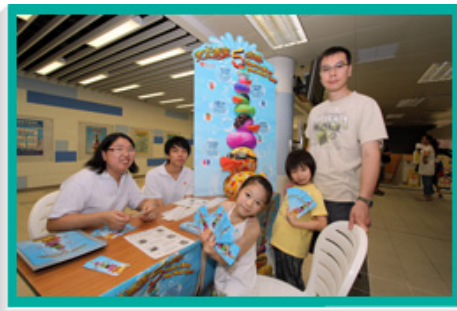
当局举办泳池清洁运动，向泳客赠送纪念品宣传保持泳池清洁的信息。

动。此外，本署举办了一项泳池清洁运动，让11岁或以下的儿童及其家长参加，藉此呼吁市民保持公众游泳池清洁。