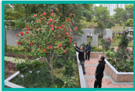
大埔海滨公园新设茶花园，游人乐在其中。