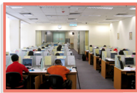
大会堂公共图书馆电脑资讯中心装设新的公众电脑工作站。

各公共图书馆共设置逾1 700个具上网功能的电脑工作站，供市民使用。随着市民对上网服务的需求日益增加，本署已提升基础设施及当中345个电脑工作站，以提供更快速的上网服务。