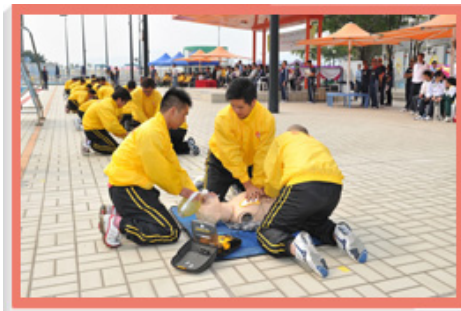
由二零一一年四月一日起，本署在辖下所有公众游泳池引入自动心脏去颤器。图中救生员示范以自动心脏去颤器急救的技巧。

为加强本署辖下游泳池的救生服务，我们由二零一一年四月一日起，为救生员安排全新的自动心脏去颤器训练课程，教导他们使用该仪器和协助他们取得相关证书。