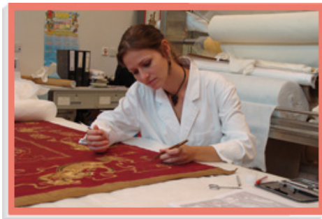
一名文物修复课程实习生正修补一幅十八世纪的挂毯。

我们亦安排员工参加海外培训和实习计划，以及前赴著名的国际文化机构进行交流，让他们有机会扩阔文化知识。在海外获得的宝贵经验和知识，可启发他们以更创新的方式策划公众活动，有助香港保持世界级盛事之都的地位。