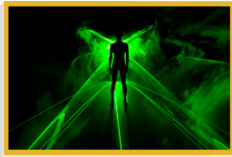
多媒体表演《卖命引擎》糅合舞蹈、录像、音乐和激光效果，利用崭新科技为观众开拓艺术体验的新境界。

本地和海外的艺人和艺团携手合作，把多出艺术节委约作品搬上舞台，包括由非常林奕华制作、汇聚中港台三地艺人同台献艺的《命运建筑师之远大前程》，以及邓树荣戏剧工作室联同戏剧盒（新加坡）制作的《后代》。另外有多个演艺节目对传统艺术进行探索，包括由日本歌舞伎大师坂东玉三郎和江苏省苏州昆剧院携手演出的中日版经典昆剧《牡丹亭》、台湾心心南管乐坊演出的首出南管现代歌剧《羽》、台湾国光剧团的新编京剧《金锁记》，以及八十后新疆乐队JAM与本地艺人合作、以现代音乐演绎的维族木卡姆爱情故事。艺术节其他精采节目还包括：享誉国际的德国现代室内乐团五位著名作曲家以珠江三角洲为题的亚洲首演音乐作品，以及由澳洲组合出奇舞创作，糅合舞蹈、录像、音乐和激光的多媒体艺术表演《卖命引擎》。