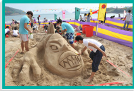
堆沙比赛在西贡清水湾第二湾泳滩举行，本地和国际堆沙好手尽显创意。

该七个位于荃湾区的已关闭泳滩在水质方面有进一步改善，所有泳滩均符合泳滩水质标准。考虑到泳滩安装新配套设施和完成改善工程所需的时间，这些泳滩会分阶段重开。四个泳滩（即近水湾泳滩、丽都湾泳滩、更生湾泳滩和海美湾泳滩）已于在第一阶段，即二零一一年六月重开。其余三个泳滩(即钓鱼湾泳滩、双仙湾泳滩及汀九湾泳滩)则计划在第二阶段重开。